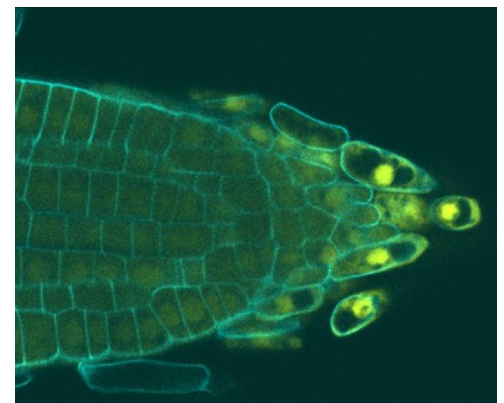
Racine de riz

Lieu: PHIV CIRAD Campus Lavalette BIOS/UMR AGAP (Bât. 2), Avenue Agropolis, Montpellier